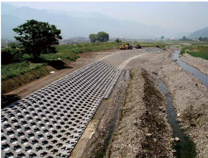
■写真-1 施工状況全景