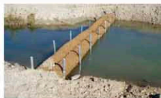
河川へ流出する手前での濁水対策