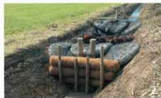
他の濁水処理工法と併用