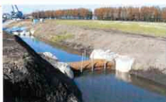
狭い排水路や小河川などの濁水対策

バイオログナチュラルフィルターは現場条件に合わせて、様々な施工方法で使用されています。