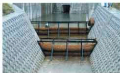
コンクリート護岸の都市河川での使用