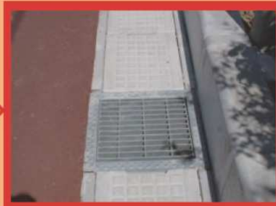
側溝にピッタリのマスへ