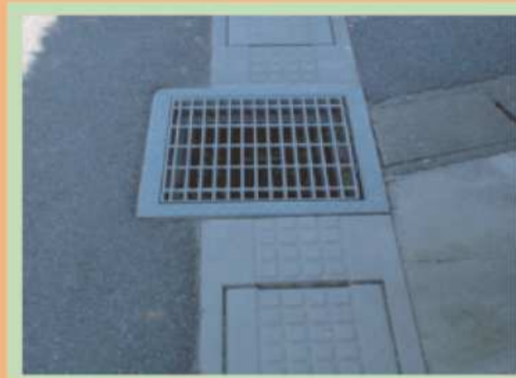
側溝からはみ出したマスから